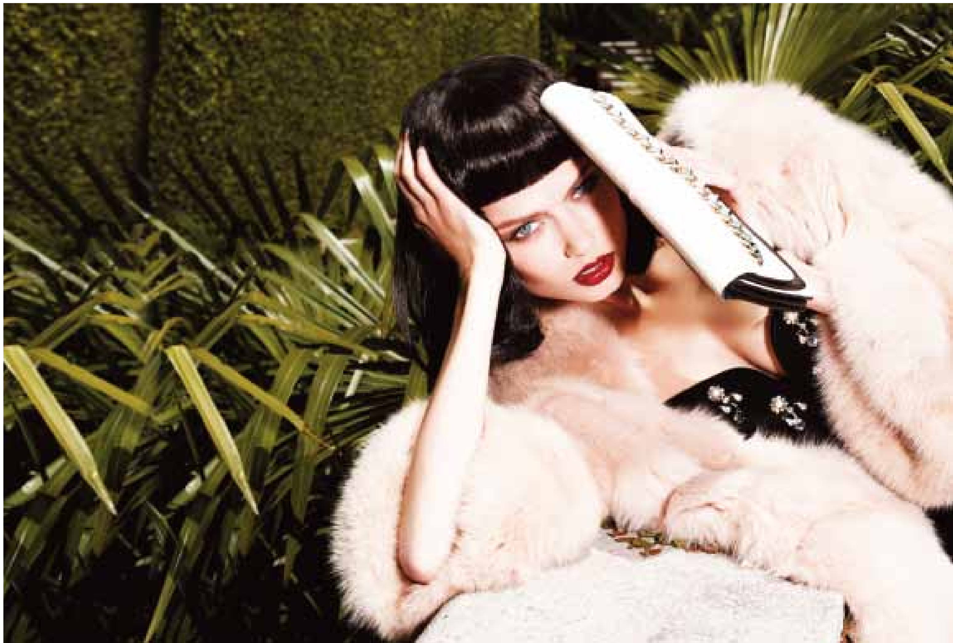
Pelliccia in zibellino rosa (Carlo Tivioli) su abito con scollo a cuore tempestato di cristalli Swarovski, strass e perle (N. 21). Clutch bicolore con catena dorata (Valentino Garavani).